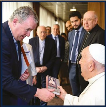
ĐTC. Phanxicô tiếp đại diện Legio Vatican — Kỷ niệm 100 năm 2022