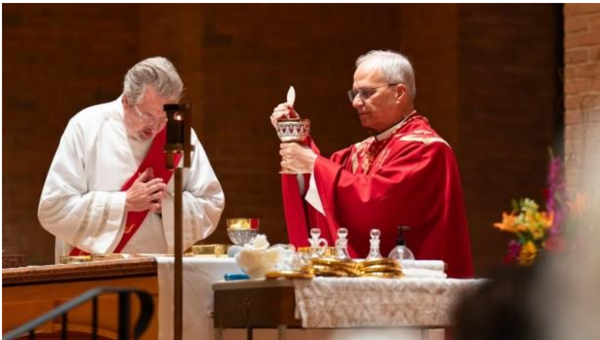
Hình khi Đức tân Giáo hoàng còn là Bề trên Tổng quyền của Dòng Thánh Augustinô